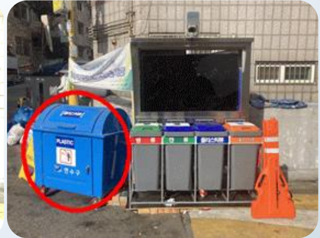
▲ 현장 점검 후 대용량 플라스틱 수거함 추가 설치