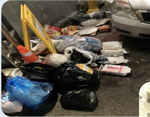
◀ 데모시스템 설치 전 쓰레기 무단투기 현장