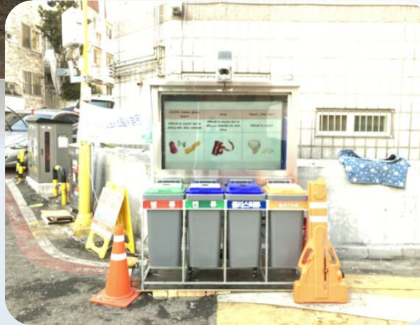
▲ 현장 데모시스템 설치 후