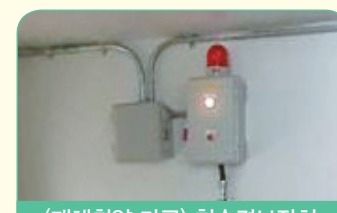
(재해취약 가구) 침수경보장치