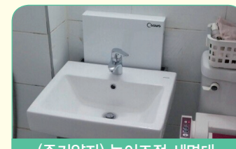
(주거약자) 높이조절 세면대