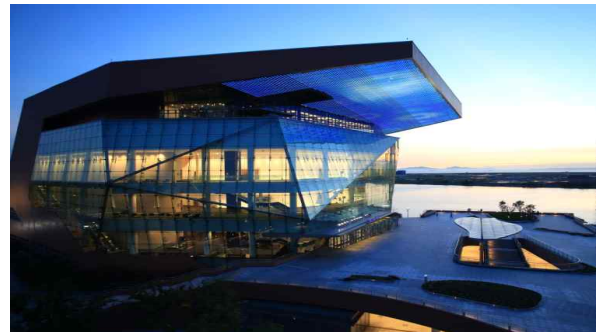
<아트센터 인천 1단계 콘서트홀>