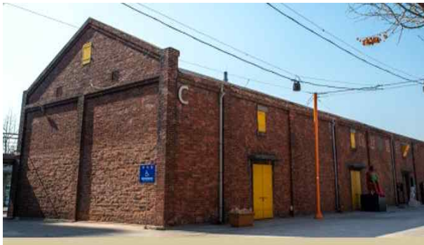
<아트플랫폼 C동 공연장>