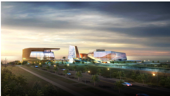
<아트센터 인천 1·2단계 조감도> (콘서트홀·오페라하우스·뮤지엄)