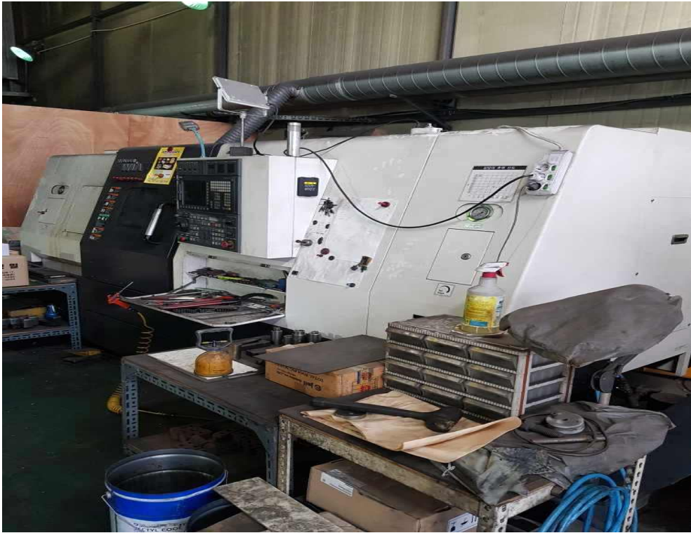
미신고 폐수배출시설(수용성 절삭유 사용) 운영 사진