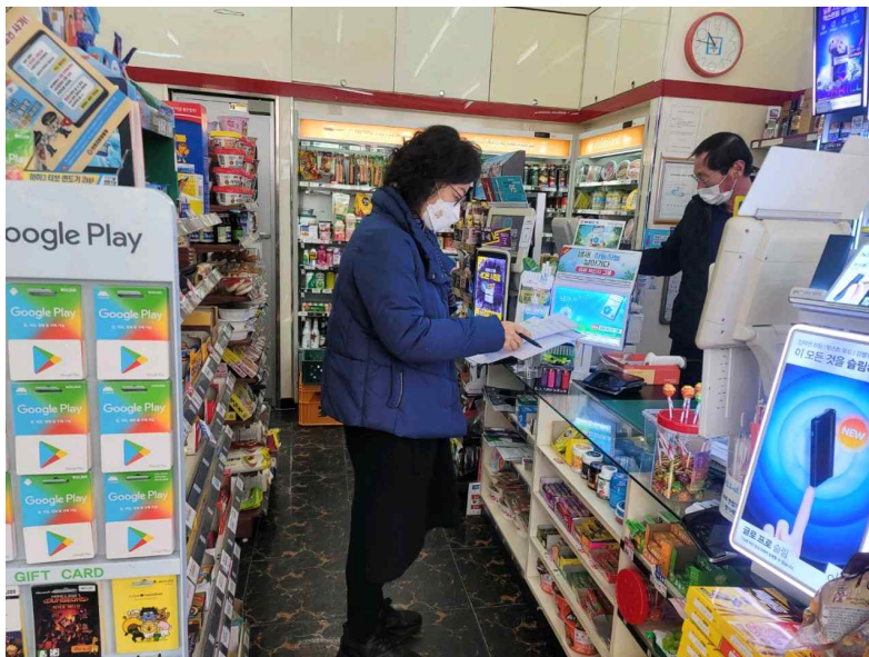
<인천 서구 학교 주변 안전점검 실시 사진.. 서구에서는 지난 2월부터 점검을 시작했다.>