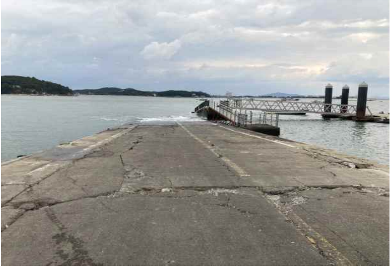
2021년 점검 時 중구 대무의항 선착장 바닥 파손 전경