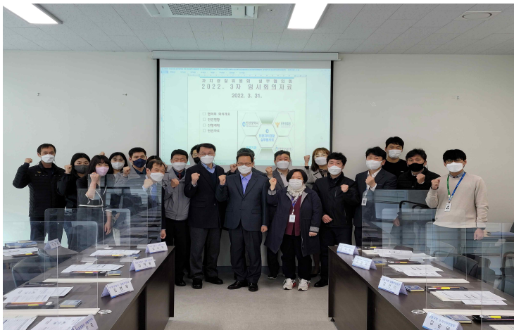
< ‘22. 3. 31. 제3차 임시회의 >