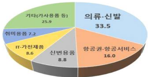
〈'21년 인천시 국제거래 소비자상담 품목별 현황〉

시기별로는 블랙프라이데이 등 연말 할인 행사로 인해 해외직구 수요가 증가하는 12월(91건, 11.7%)에 가장 많은 상담이 접수됐으며 3월(80건, 10.3%)과 4월(70건, 9.0%) 순으로 나타났다.