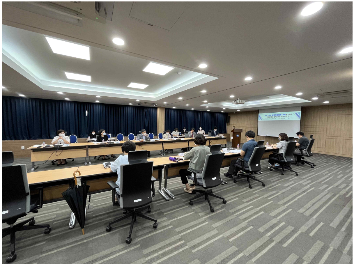
「1인 가구 정책지원체계 구축을 위한 빅데이터 분석 용역」 착수보고회 사진('22. 6. 29.)