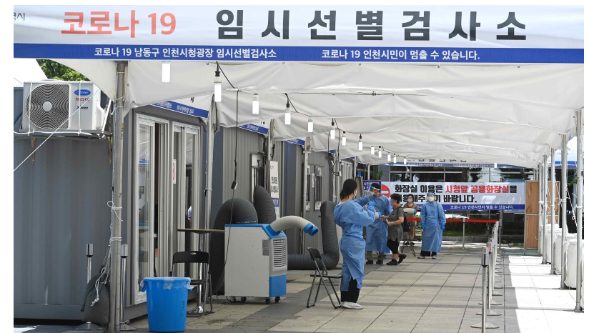
< 인천시청 앞 광장 임시 선별검사소 사진 >