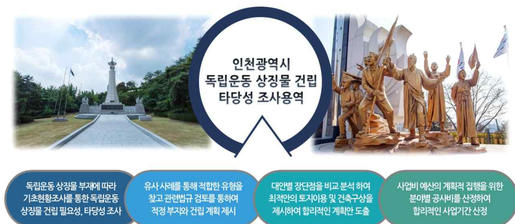
[그림 1-1] 과업의 필요성