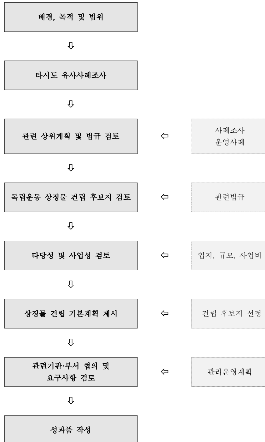
[표 1-2] 과업수행절차