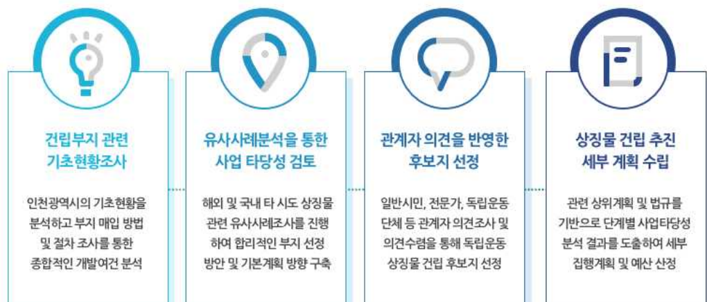
[그림 1-2] 과업기본방향