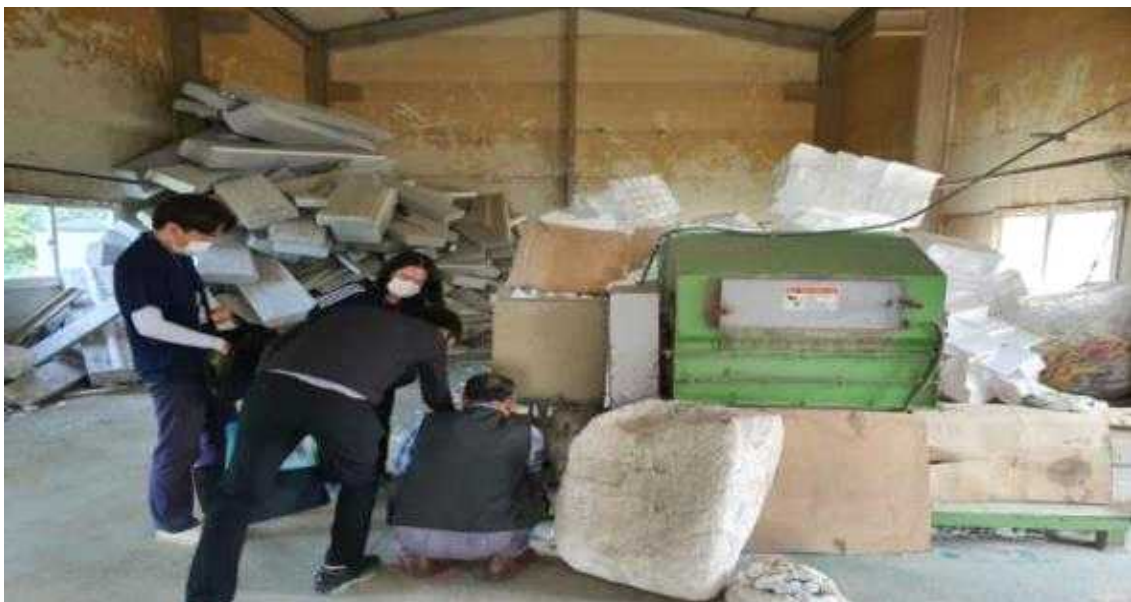
미허가 폐기물처리업체 운영 사진