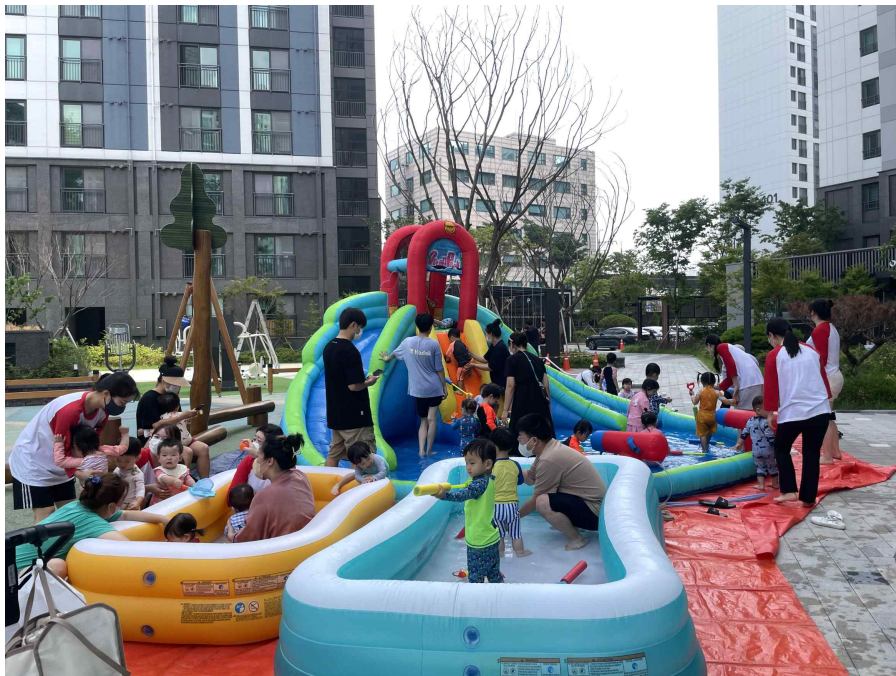
부개3구역 현장 사진