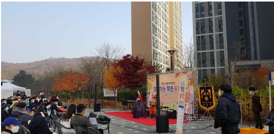
남동구 아파트 입주민을 위한 작은 음악회