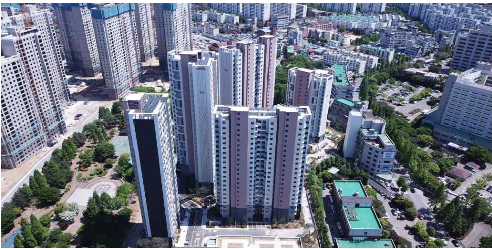
학익2구역 현장 사진