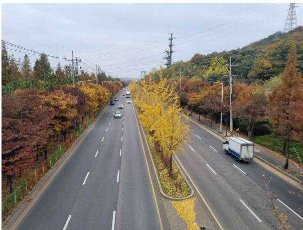
남동구 소래로 전경