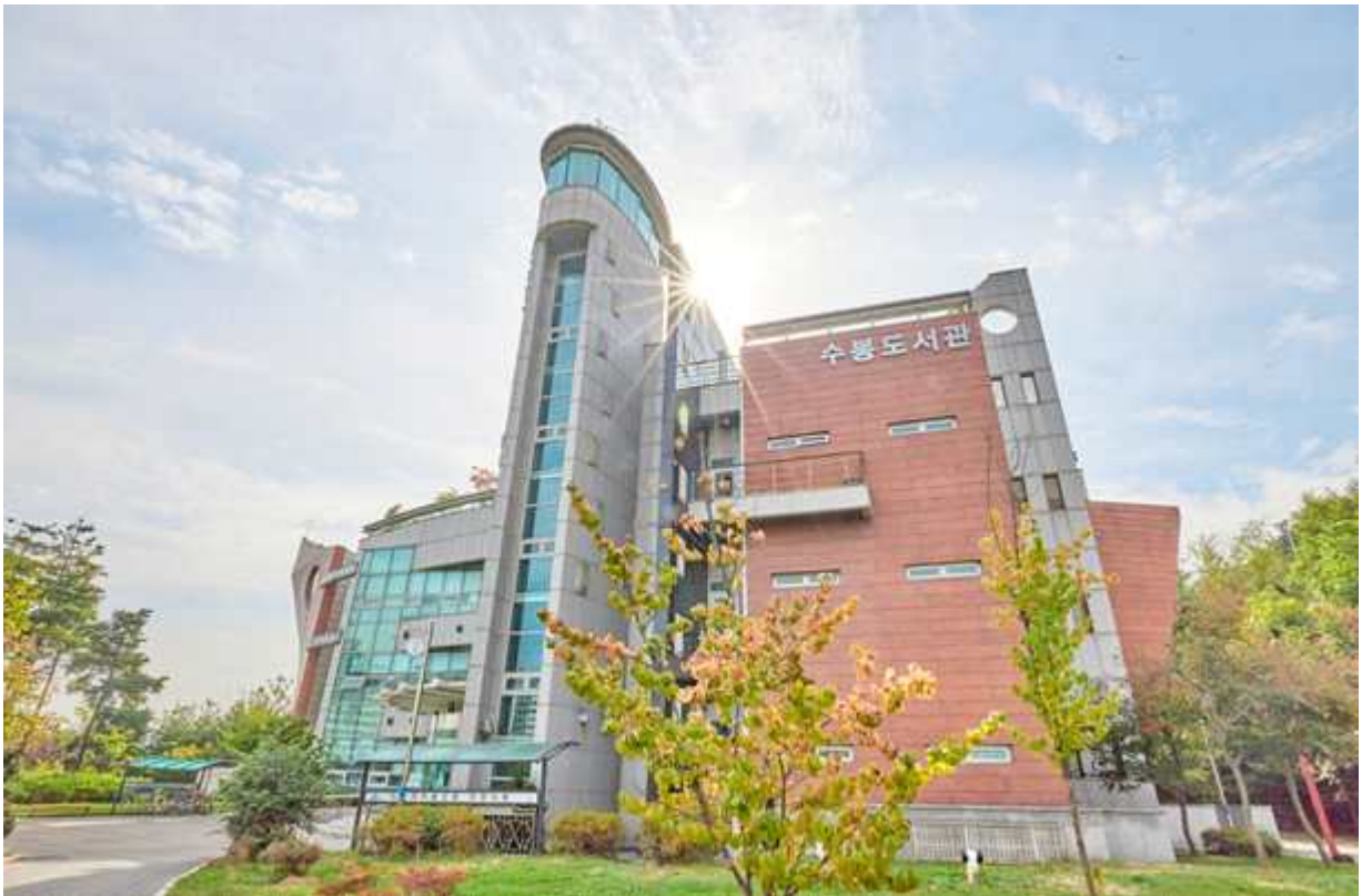
[사진] 2. 제55회 한국도서관상 시상식 사진

※ 관련 사진은 행사 종료 후 인천시 홈페이지 '보도자료'에 게시될 예정입니다.