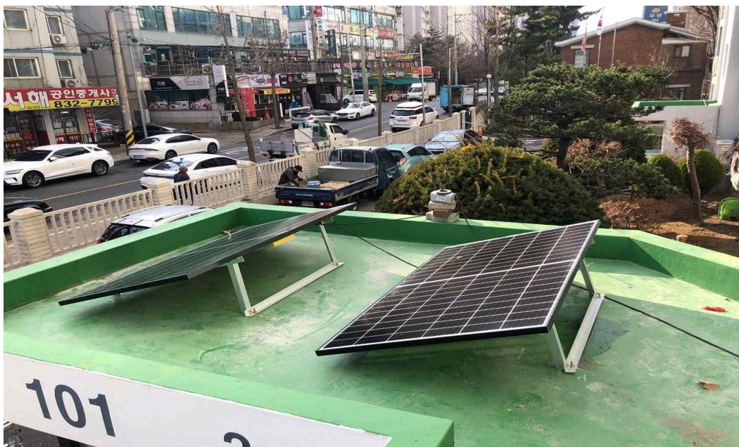
<아파트 경비실 설치 사진>