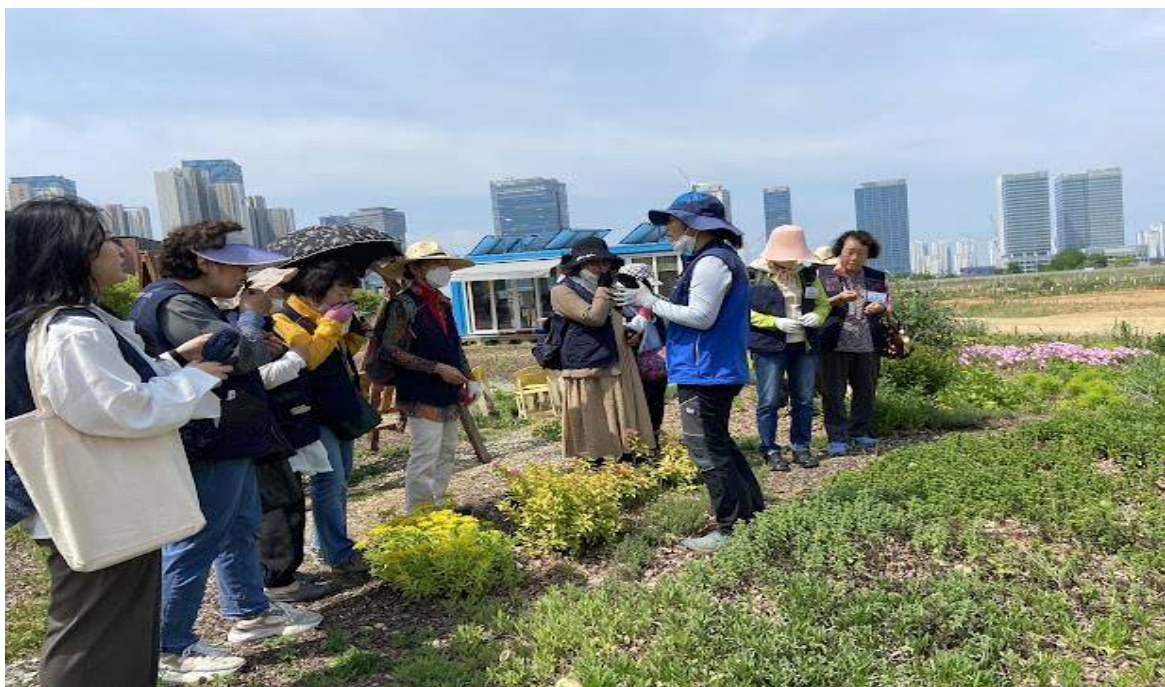
이음텃밭 전경 및 22년 텃밭 체험활동 모습