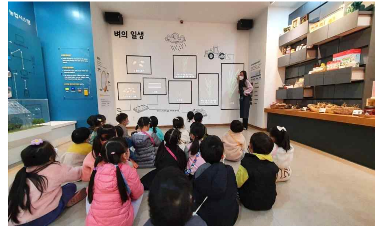
<검토후> 어린이 농부교실 사진

자세한 사항은 인천광역시 농업기술센터 홈페이지 교육·행사 게시판( www.incheon.go.kr/agro )을 참고하거나 시민교육팀(☎032-440-6934)으로 문의하면 된다.