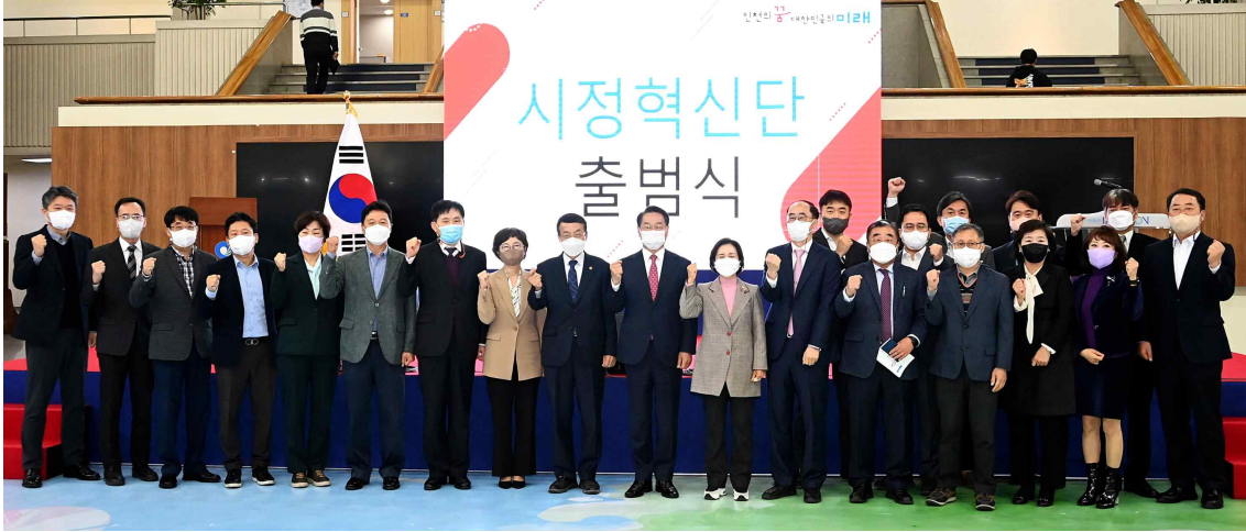
2022년 10월 24일 시정혁신단 출범식