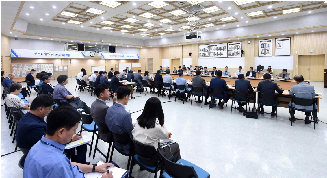
2023년 7월 7일 2023 상반기 시정혁신과제 추진상황 보고회