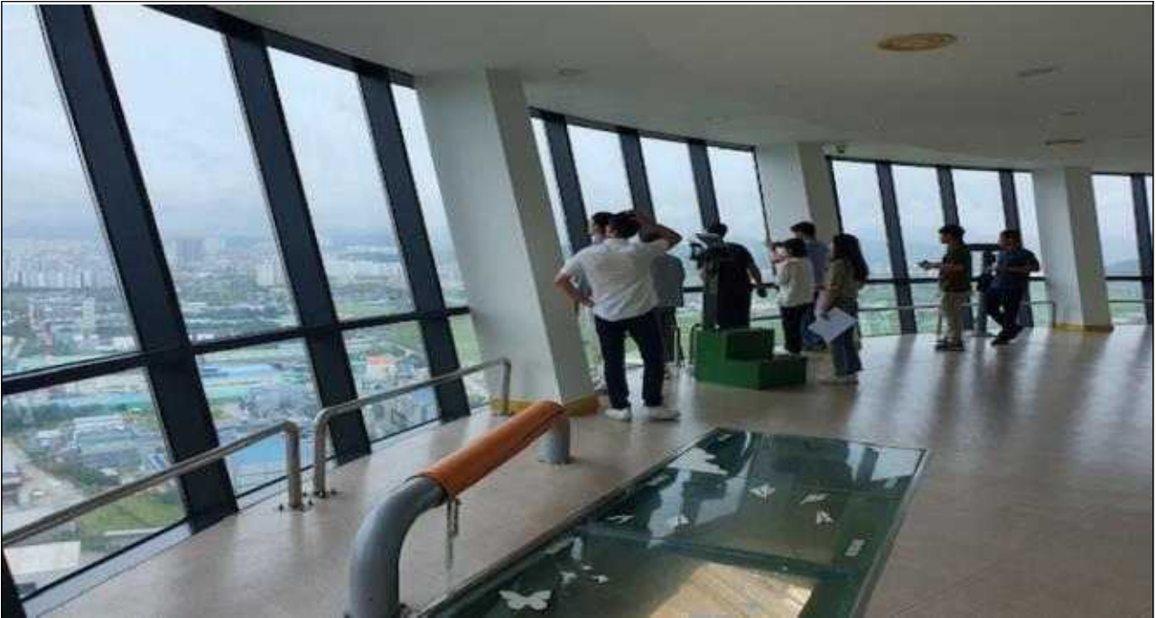
아산환경과학공원 굴뚝 전망대