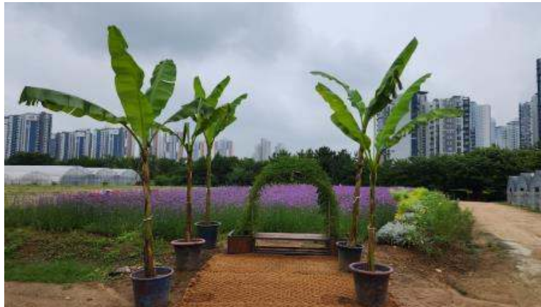
2. 연희공원 버들마편초 포토존