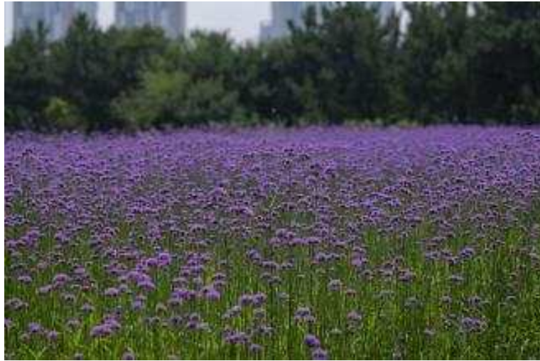
1. 연희공원 버들마편초 꽃밭