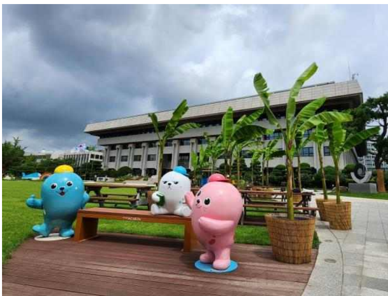
3. 인천애들 파초