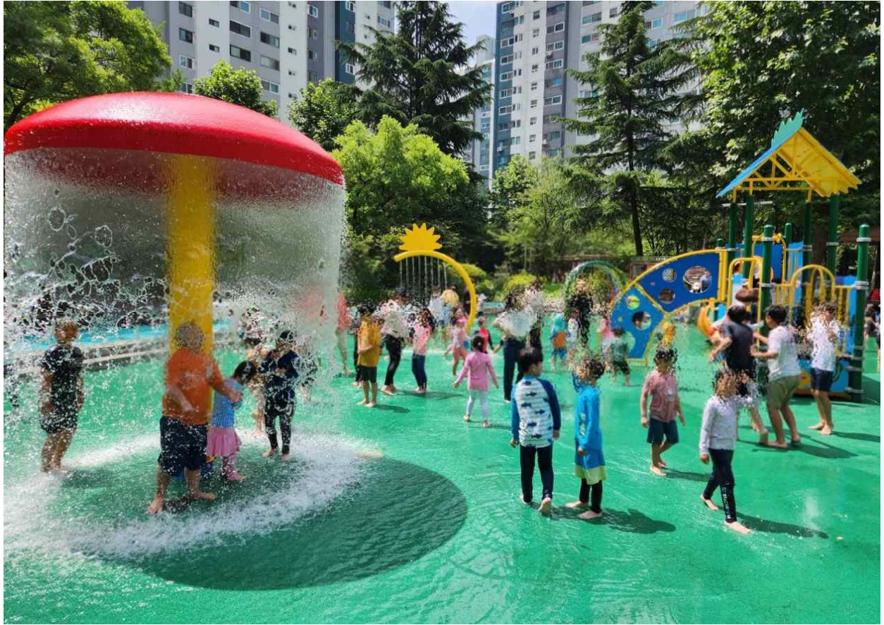
연수구 부수지공원 물놀이장의 아이들의 즐거운 시간