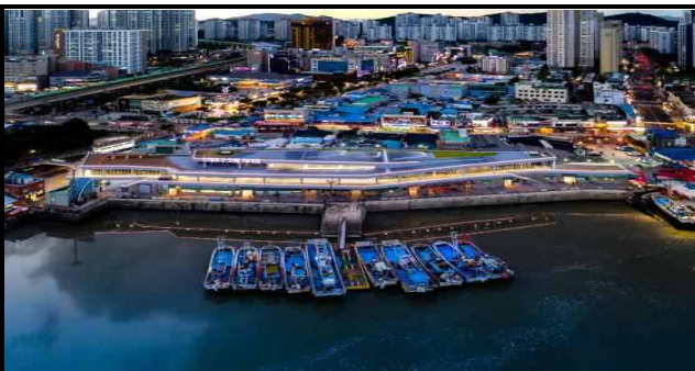
시장 외부 전경