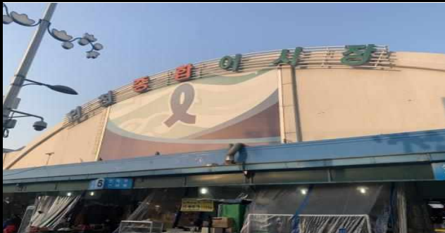
시장 외부 전경