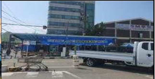
행사 안내 현수막