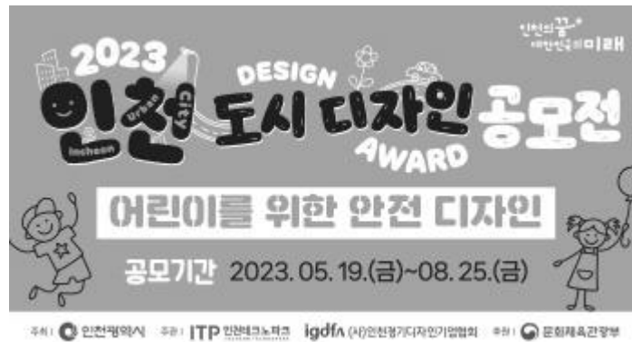
▲ 공모전 배너