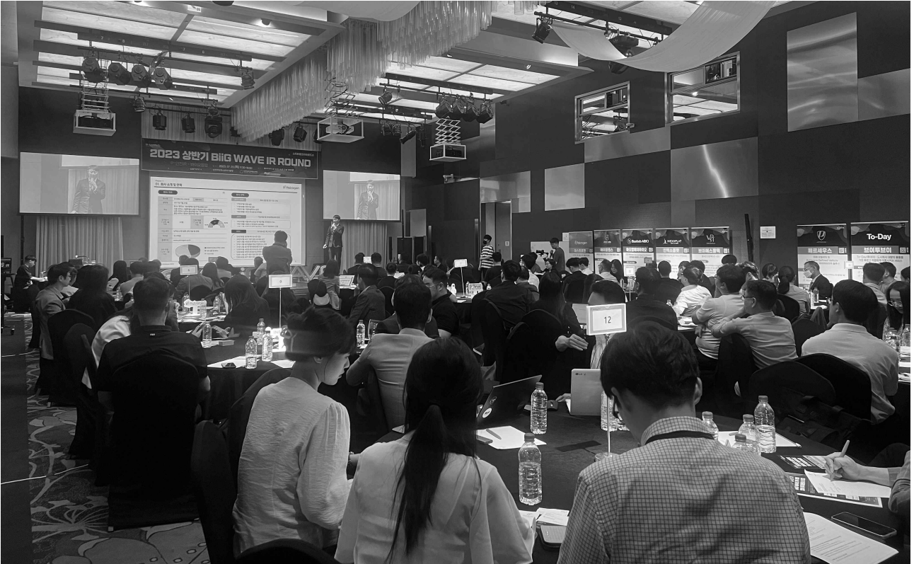
△ 지난 7 20 ! 인천 송도에서 열린 빅웨이브 투자유치 설명회