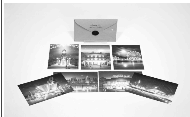
최우수상(심야인천 엽서 7종)