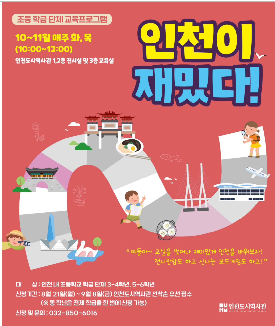
인천도시역사관 초등 학급 단체 교육프로그램 <인천이 재밋다!> 홍보 포스터