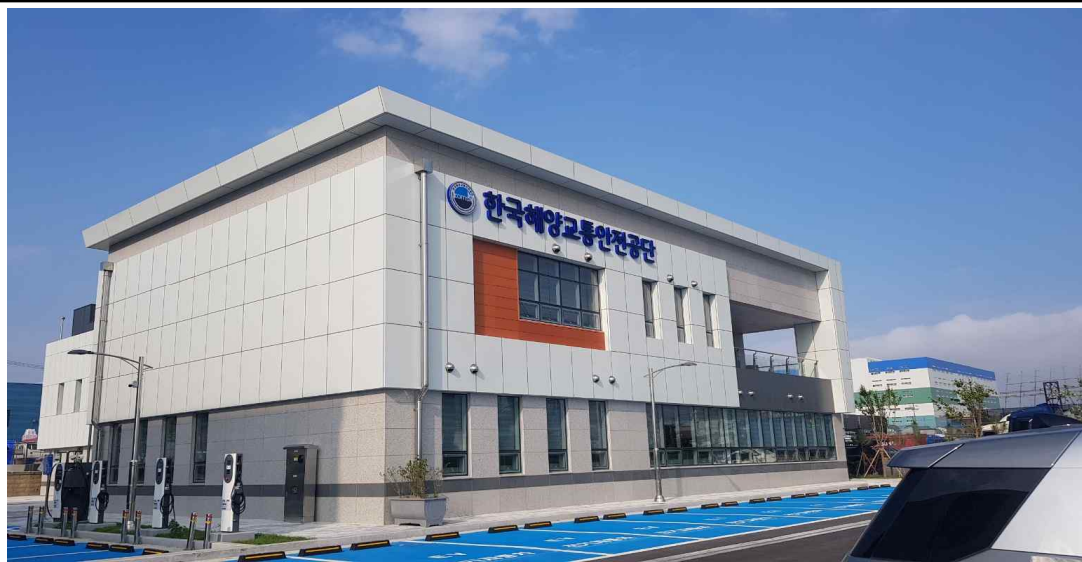
인천 스마트선박안전지원센터 사무동 전경