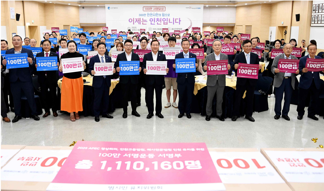
▲ 유정복 인천광역시장이 29일 시청 대회의실에서 열린 '2025 APEC 정상회의·인천고등법원·해사전문법원 인천유치 100만 서명부 전달식'에서 범시민 유치위원회에게 서명부를 전달받은 뒤 결의구호 퍼포먼스를 하고 있다.