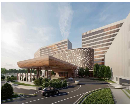
<조감도, 인스파이어 제공>