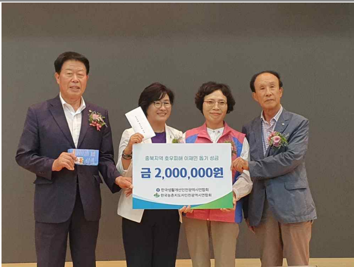
충북지역 이재민 성금 전달