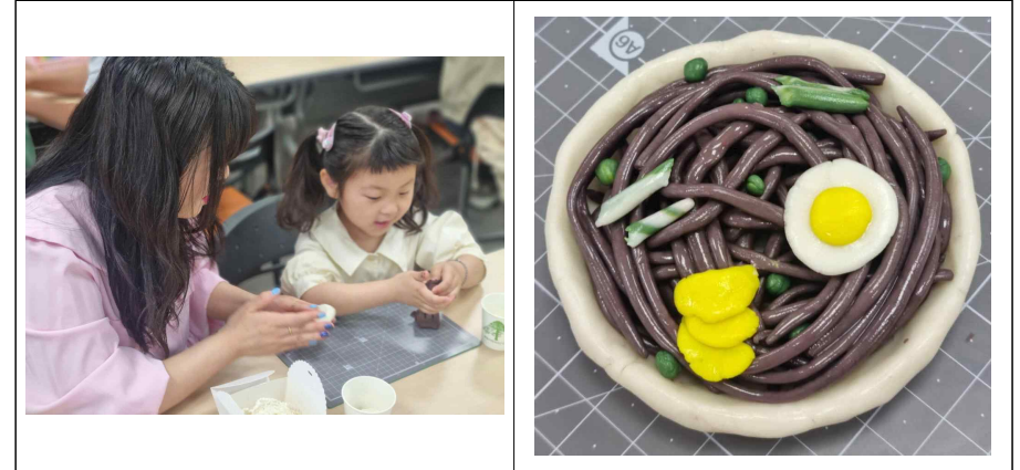
<교육 진행 사진>