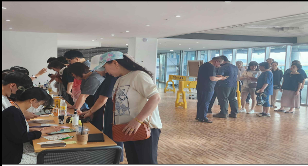
지급 행사장(6월 행사)