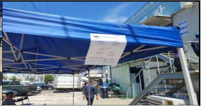
비상연락 및 지원인력 명단