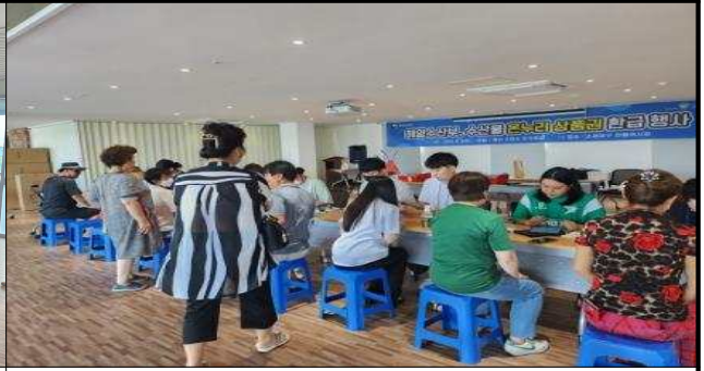
지급 행사장(8월 행사)