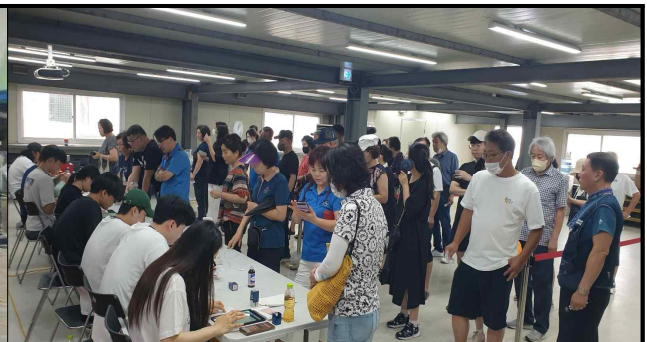
지급 행사장(8월 행사)