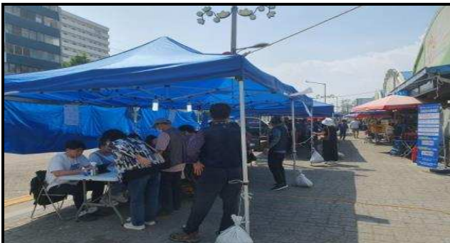
지급 행사장(6월 행사)