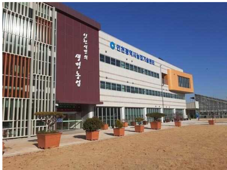
인천시 농업기술센터 전경