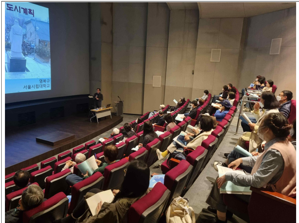
<2023년 양성교육 사진>