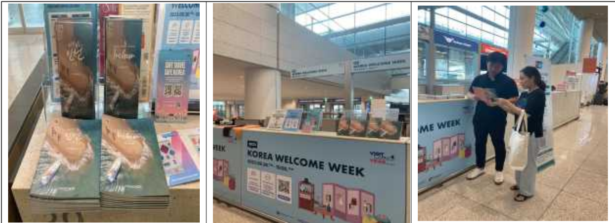
인천국제공항 환영주간 홍보/2023.9.26.~10.5 (공항 내 4개소 홍보부스 지원)