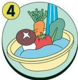
채소, 과일은 깨끗한 물에 충분히 씻어 먹기