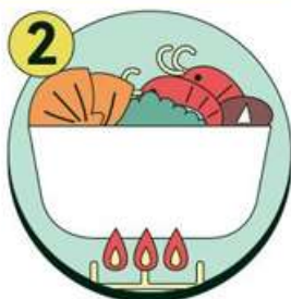
음식은 충분히 익혀 먹기