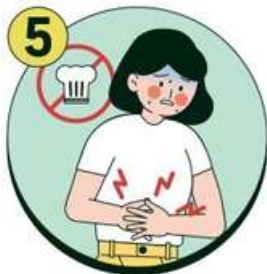
설사 증상이 있는 경우 음식 조리 및 준비 금지