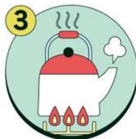
물은 끓여 마시기