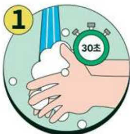
올바른 손씻기 생활화