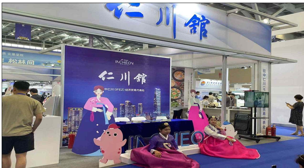
<제3회 한국(산동)수입상품 박람회 참가 사진>