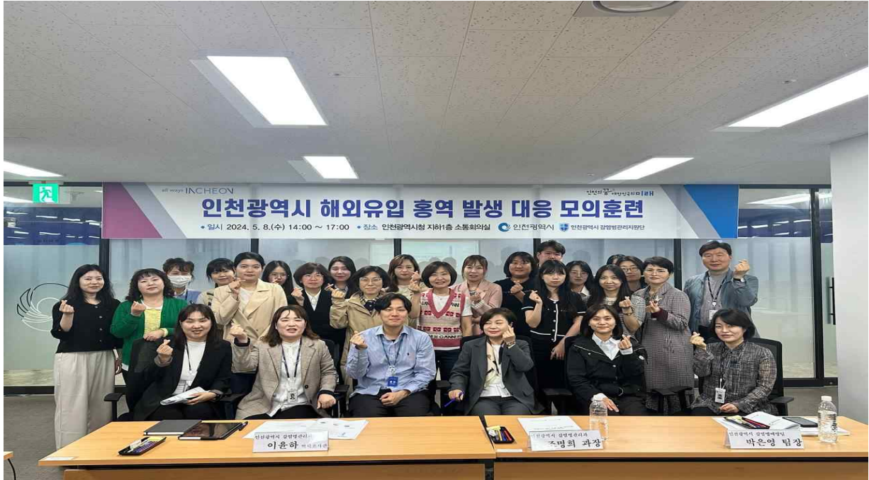
모의 훈련 단체 사진