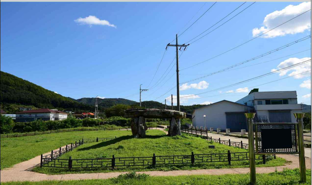
강화 부근리 점골 고인돌 <인천광역시 기념물, 1995.3. 2. 지정>