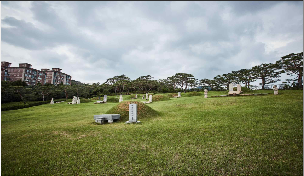
영신군 이이묘 <인천광역시 기념물, 1999.3.29. 지정>