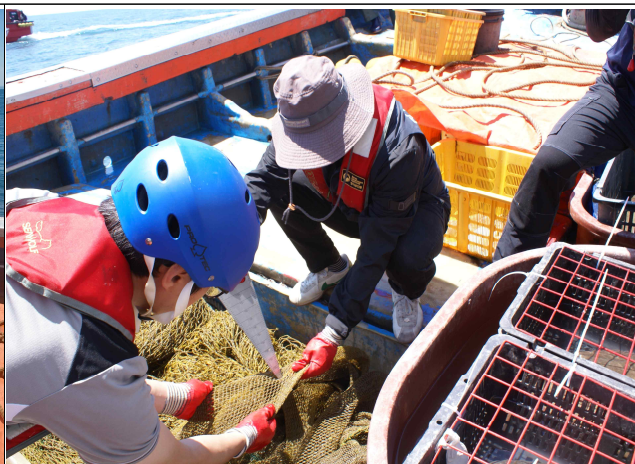
어구의 규모 등의 제한 위반(그물코 규격 위반)