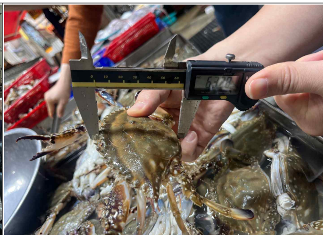
불법 어획물의 판매 등의 금지(꽃게 금지 체장 위반)