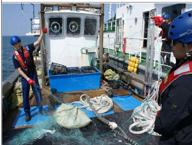
2중 이상 자망 사용금지 위반