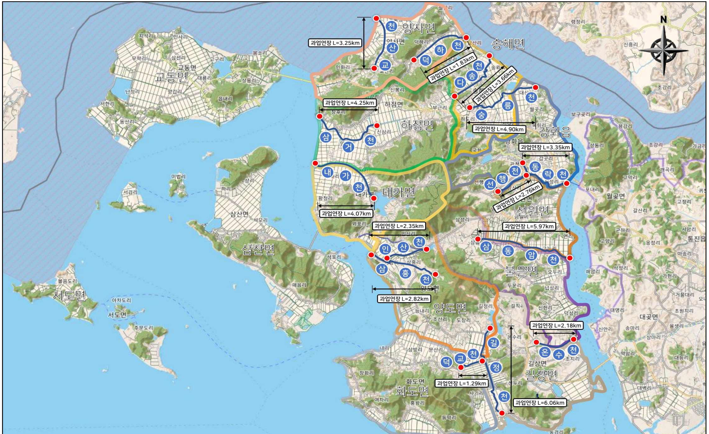
[그림 1.2-2] 지방하천 위치도(강화군)