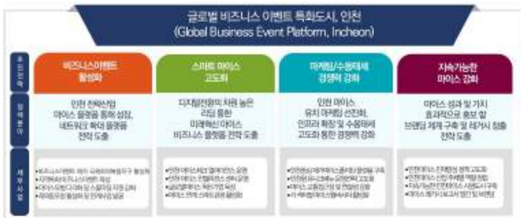
[그림 4-1] 인천시 마이스산업 비전 및 전략