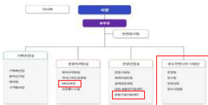
[그림 3-3] 인천관광공사 조직도