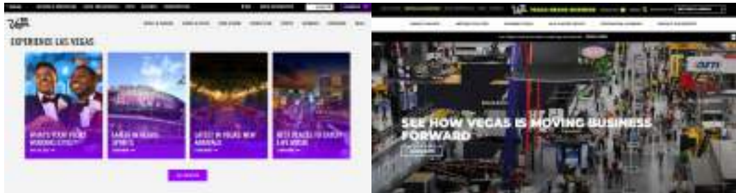
[그림 2-1] 라스베이거스 공식 홈페이지와 비즈니스 홈페이지 비교