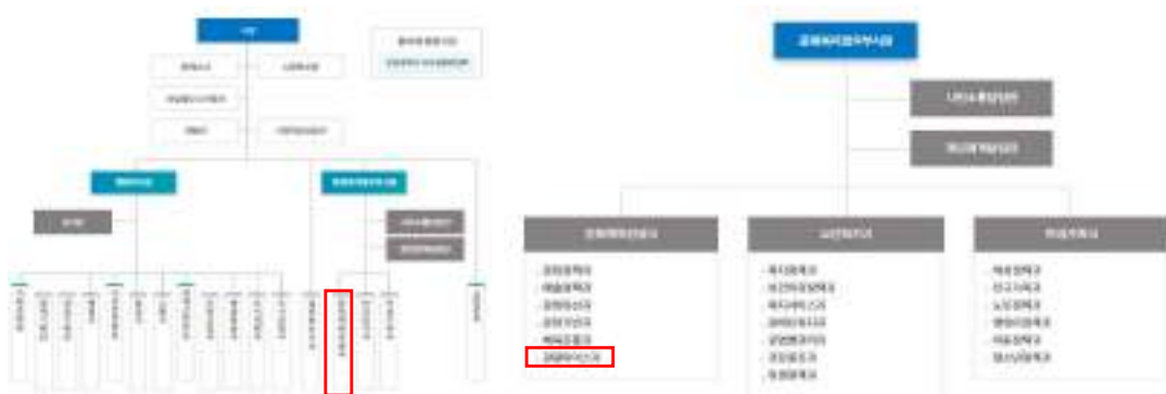
[그림 3-2] 인천광역시 관광마이스과 조직도