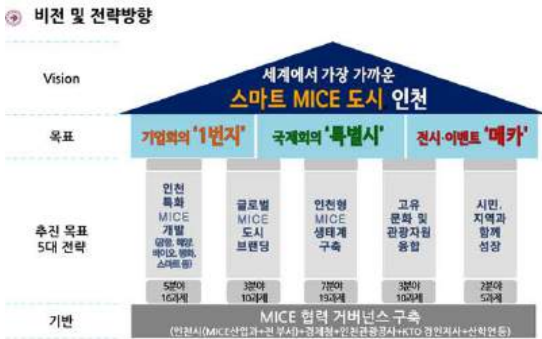
[그림 3-1] 인천광역시 마이스산업 중장기 종합발전계획(2018~2022) 추진 전략 및 정책