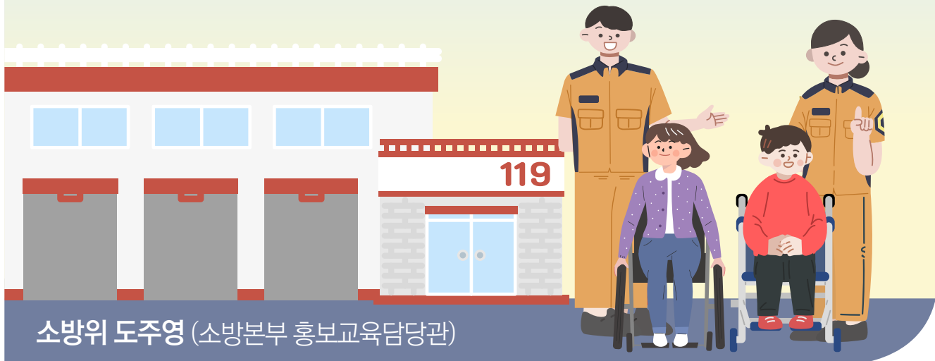
소방위 도주영 (소방본부 홍보교육담당관)