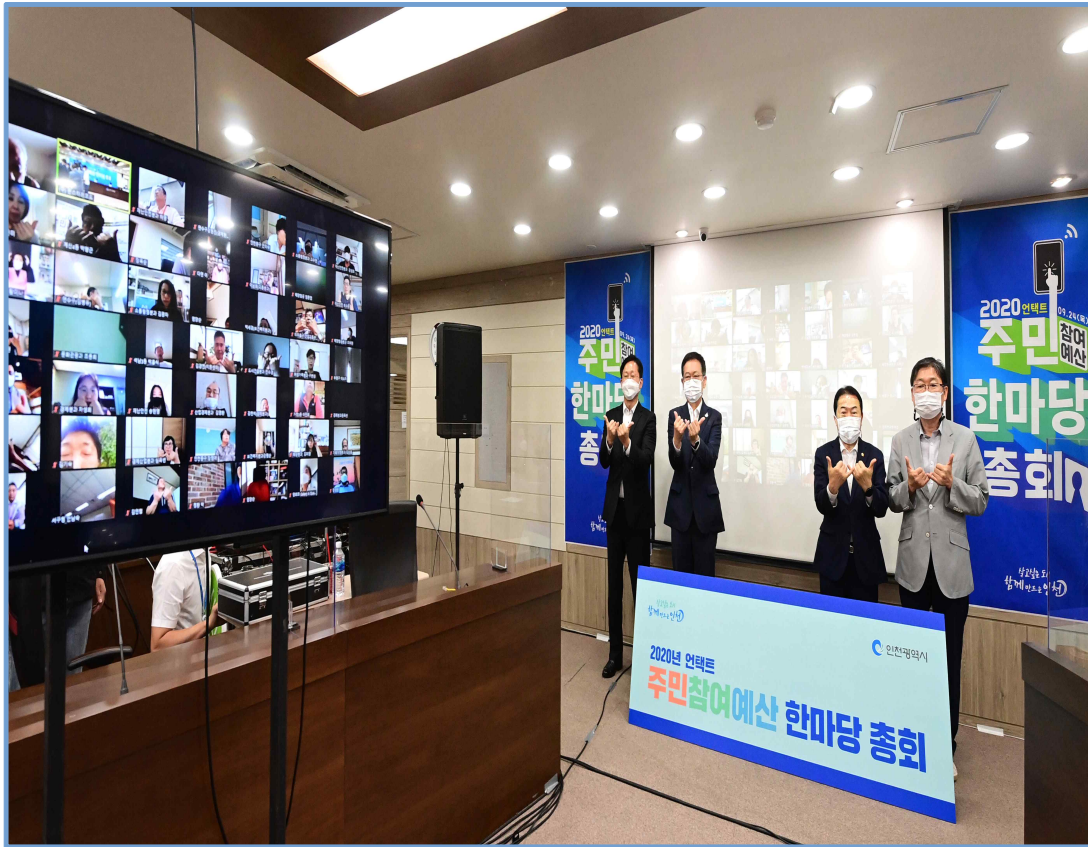
붙임: 참고사진(2020년 주민참여예산 총회 개최)