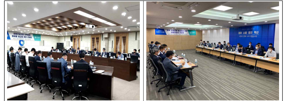
<참고사진> 대형건설산업 지역업체 참여율 제고 간담회