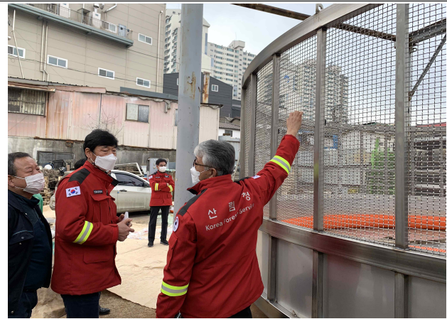
담수용 저수조 현장점검 (인천대공원사업소)