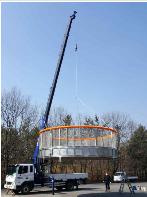
담수용 저수조 현장 조립(인천대공원사업소)