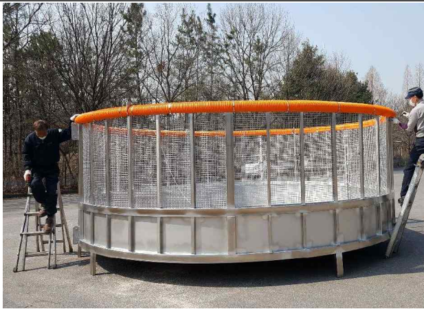
담수용 저수조 현장 조립(인천대공원사업소)