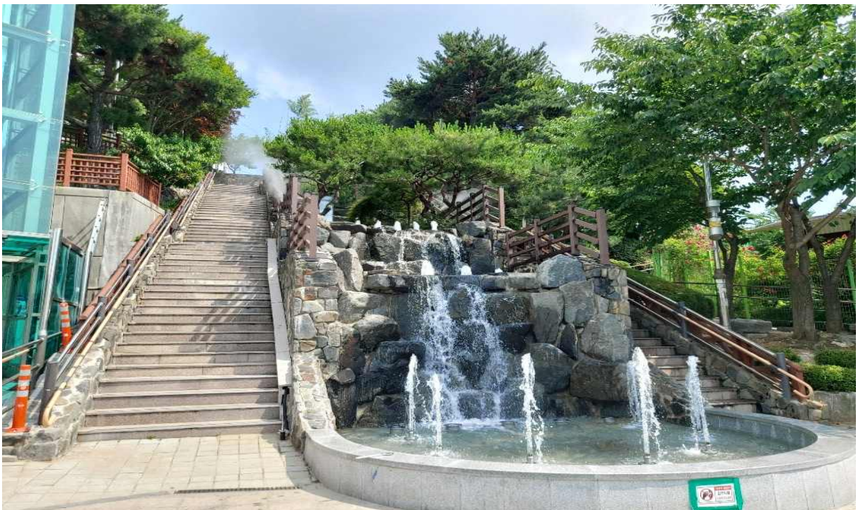
<2020년도 추진사업, 중구 도원동 70계단 광장쉼터 조성>