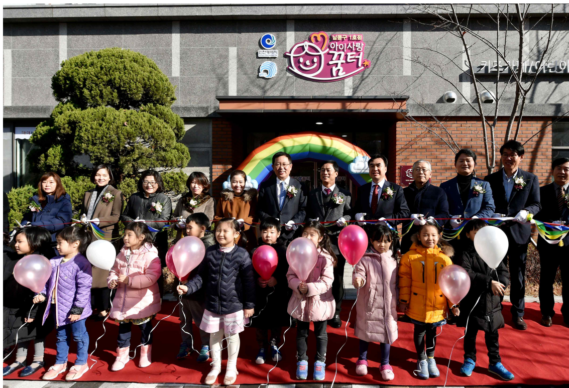
〈남동구 아이사랑꿈터 1호점 개소식〉