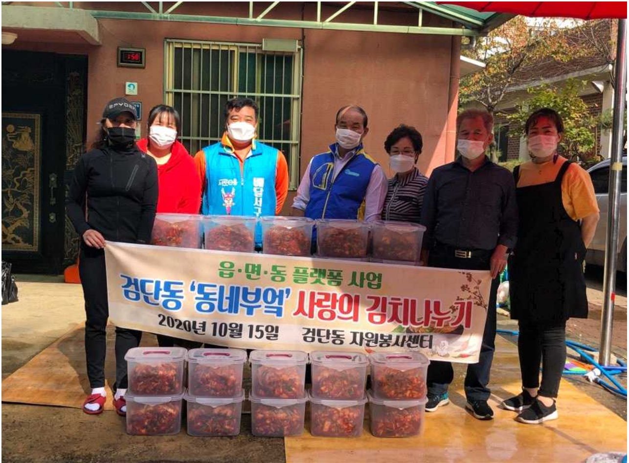
2020년 읍면동 플랫폼 사업(서구 검단동, 반찬 품앗이 “동네부엌” 자원봉사자들이 직접 만든 김치를 취약계층에 전달